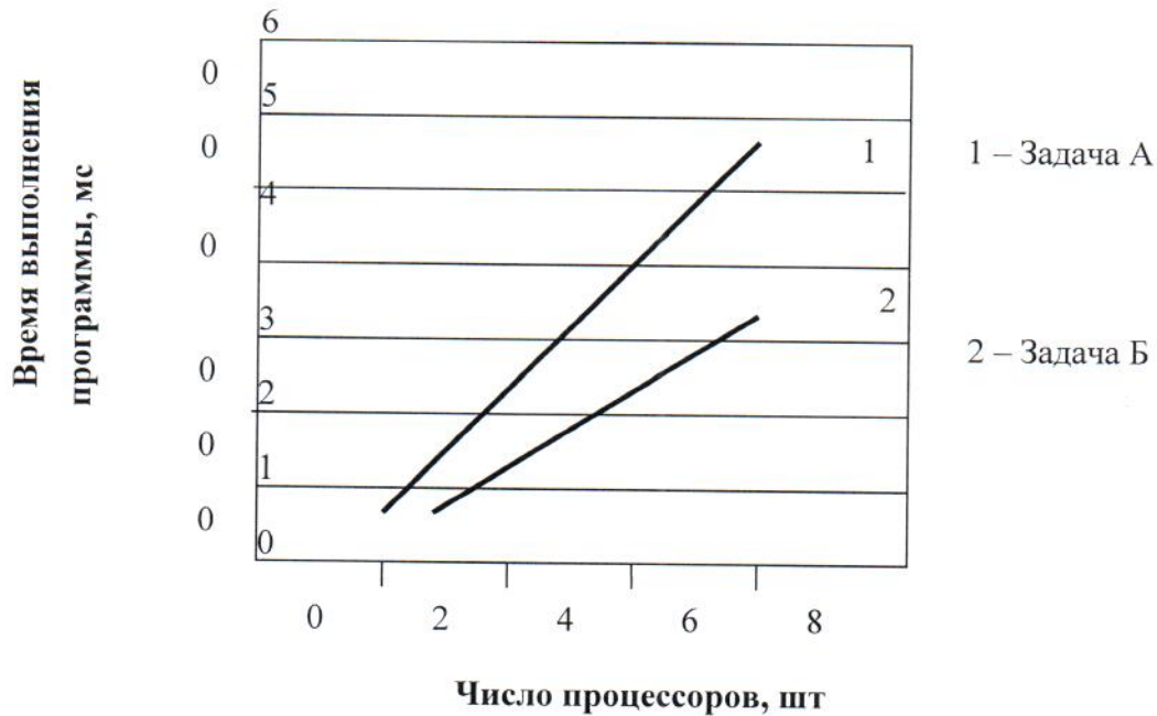
Рис. П 2.1.

Пример графика с результатами эксперимента показан на рис. П .2.1.